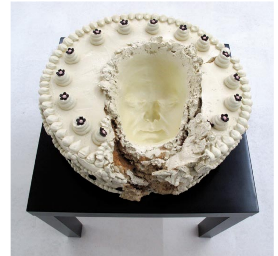
VIA LEWANDOWSKY | „ETERNAL SURPRISE" | 2011 | POLYESTER LACKIERT | Ø 45 cm