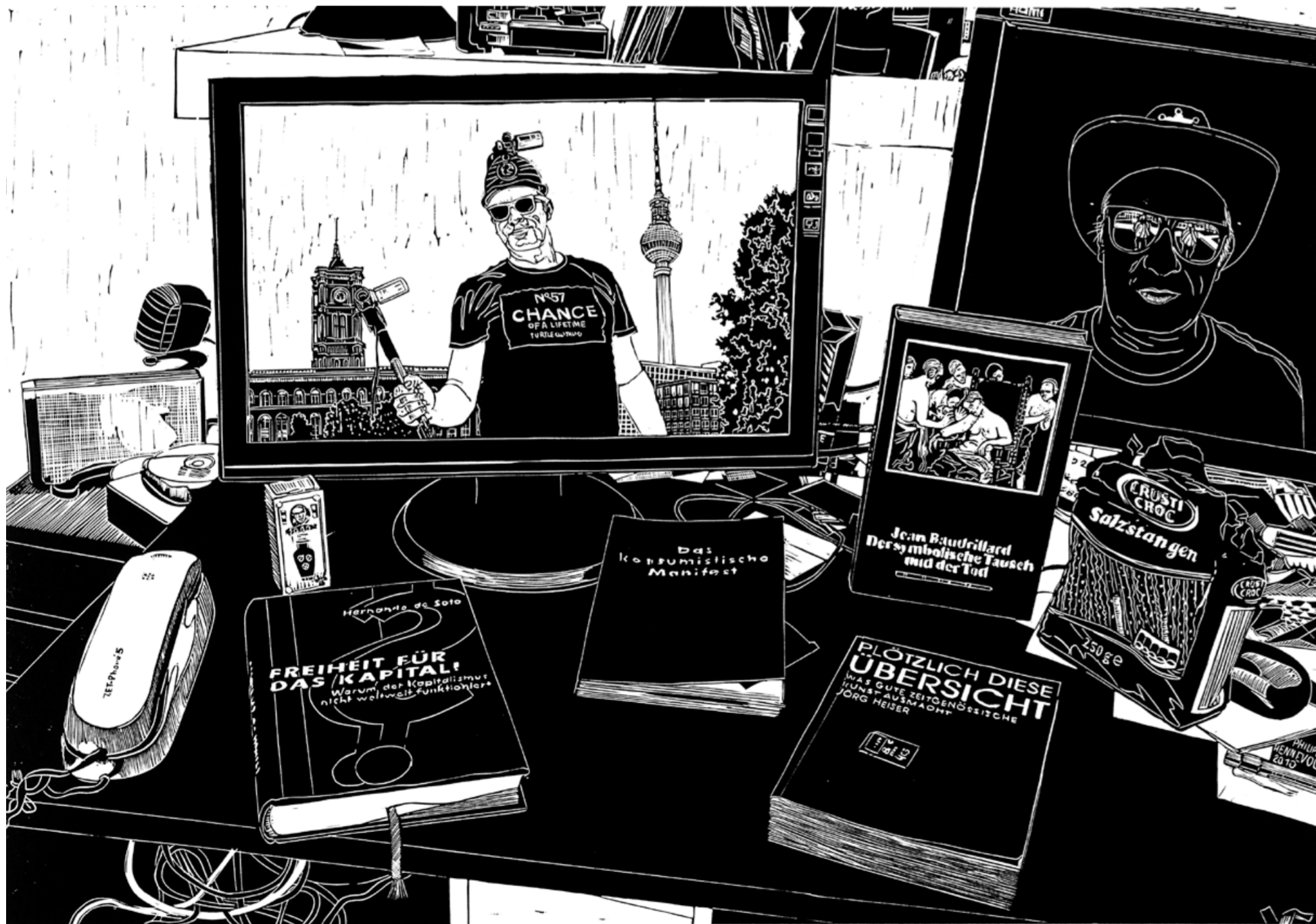
PHILIPP HENNEVOGL | KONSTANTIN DER KUNSTKONTAKTER | 2010 | LINOLSCHNITT | BILD 55 X 67, PAPIER 70X90 | EDITION 7 + 1