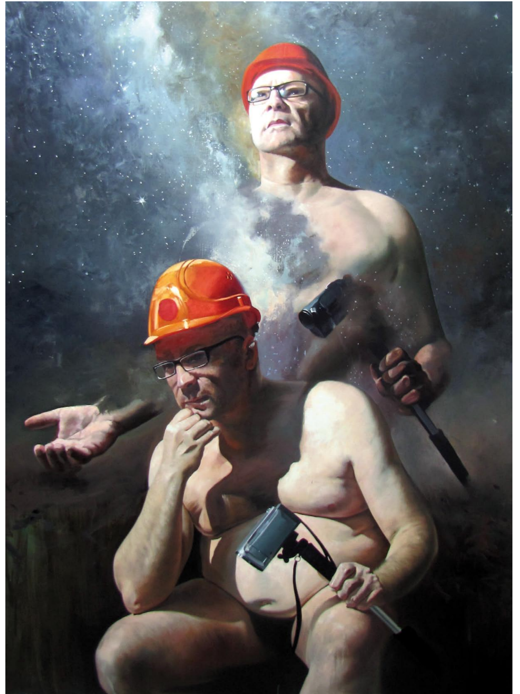
ROLF OHST | STAND UP | 2011 | ÖL AUF LEINWAND | 150 x 200 cm