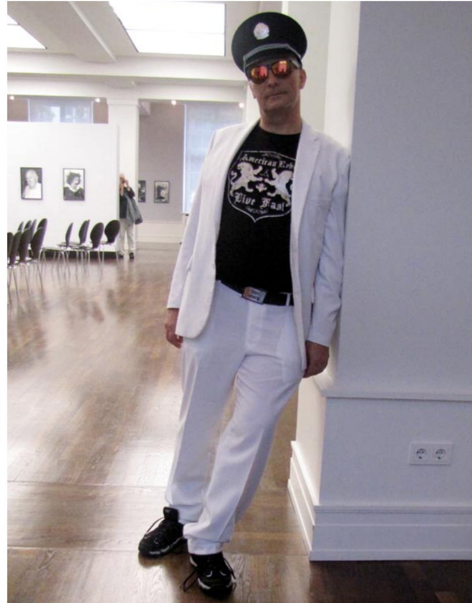
JUNE NEWTON | DRUNKEN REBEL | 2010 | DIASEC | 20 x 30 cm