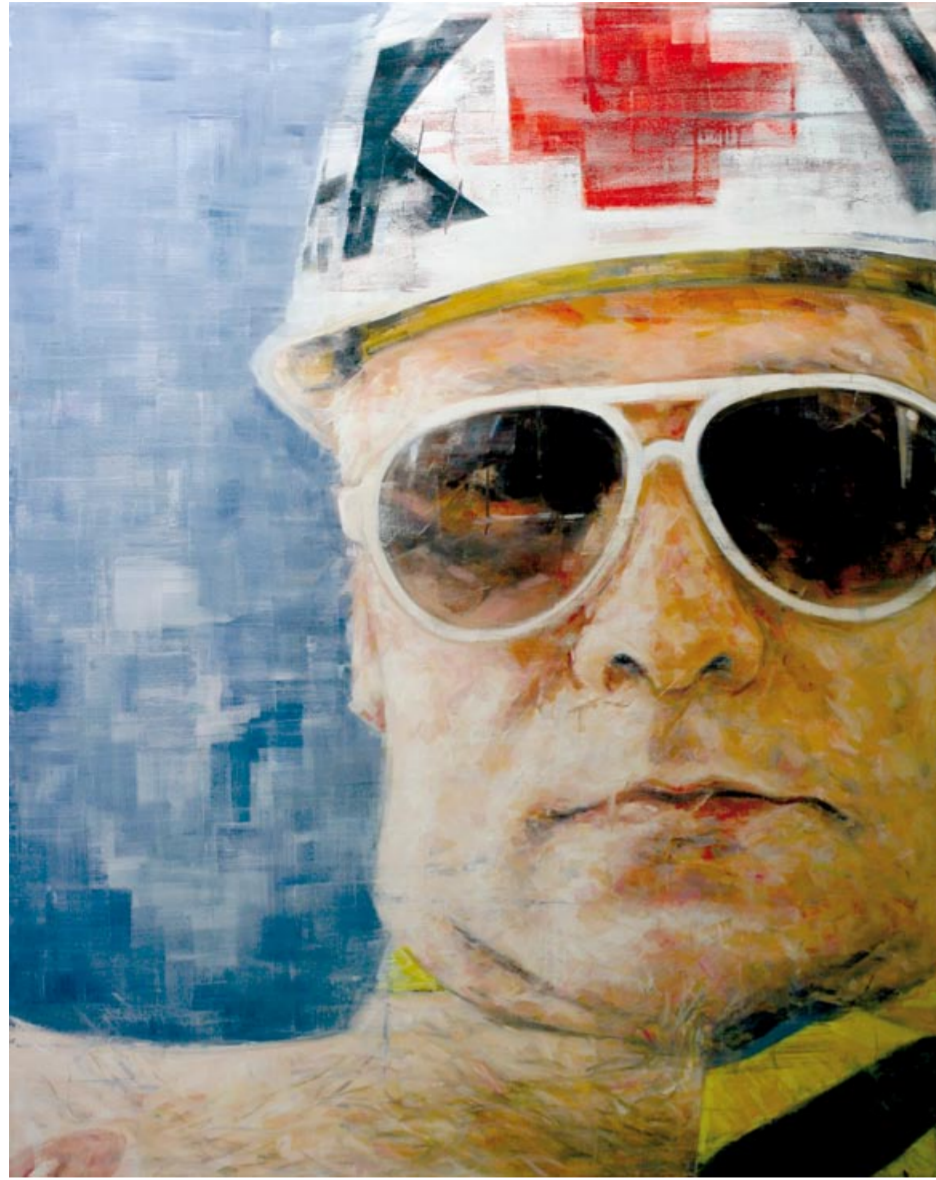
HARDING MEYER | KARLSRUHE | 2011 | ÖL AUF LEINWAND | 170 x 190 cm