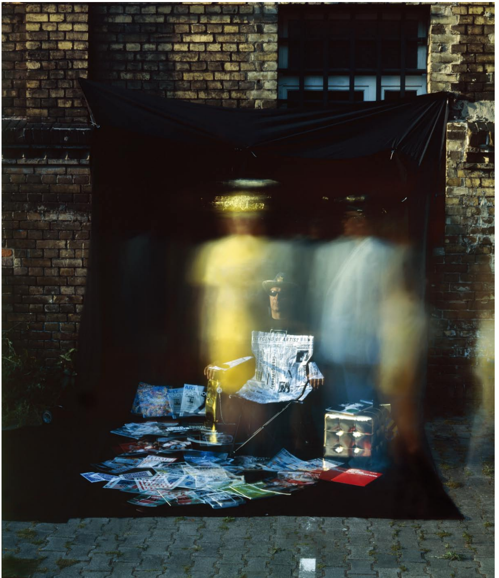
ROLAND WIRTZ | SHADOWS OF THE BRIGHT | 2010 | C-PRINT | 200 x 300 cm