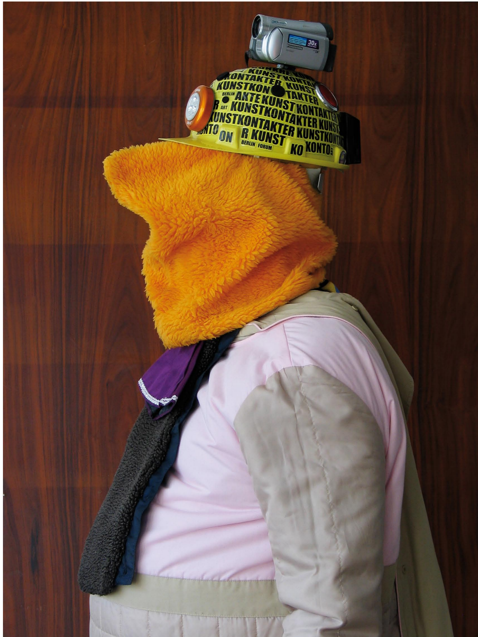
THORSTEN BRINKMANN | KAMERATIKUS VAN AUTOMATIKUS | 2011 | C-PRINT | 82 x 62 cm