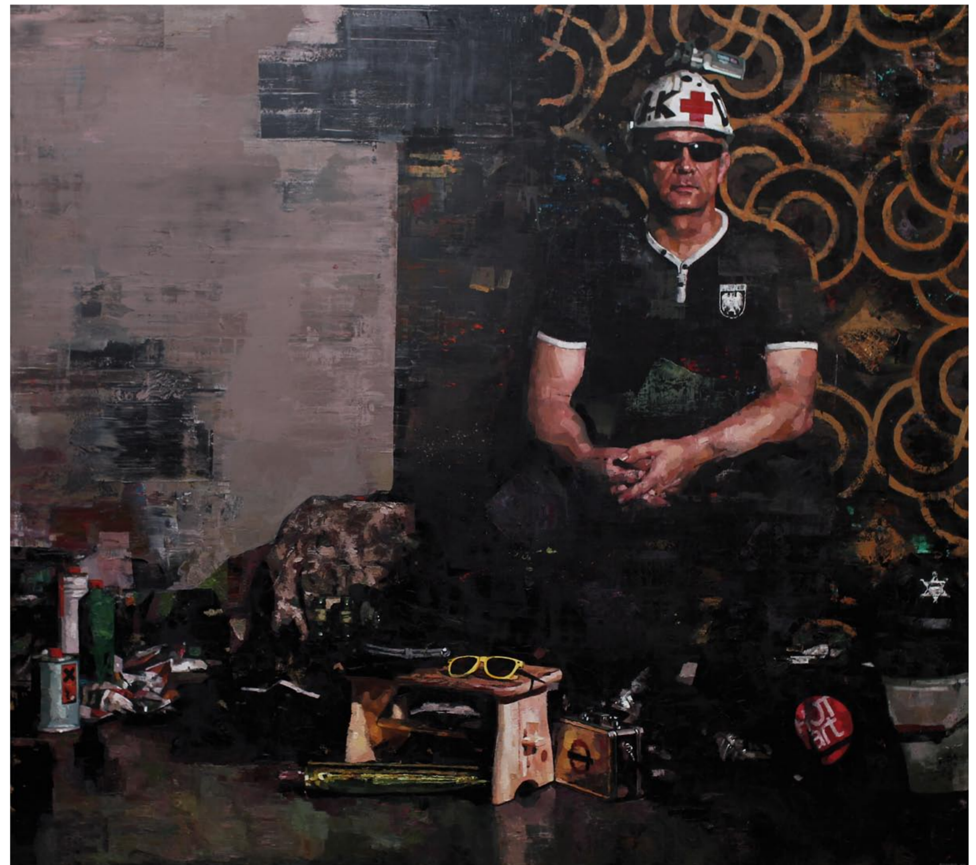
SEBASTIAN SCHRADER | DR. K'S SHORT SUMMER BREAK | 2011 | ÖL AUF LEINWAND | 190 x 170 cm