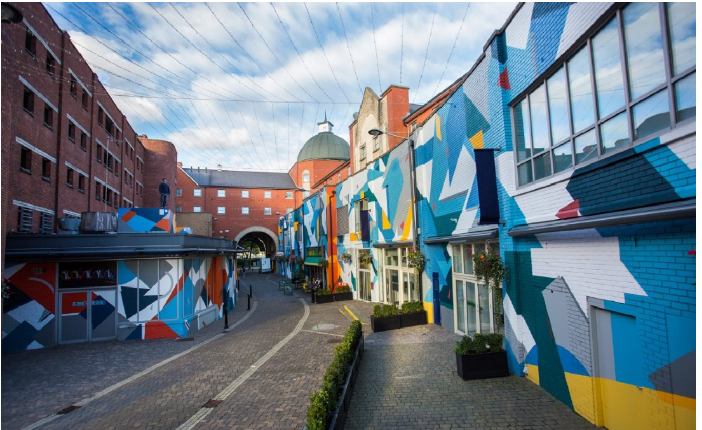
KERA Mural - Swansea, Wales GB