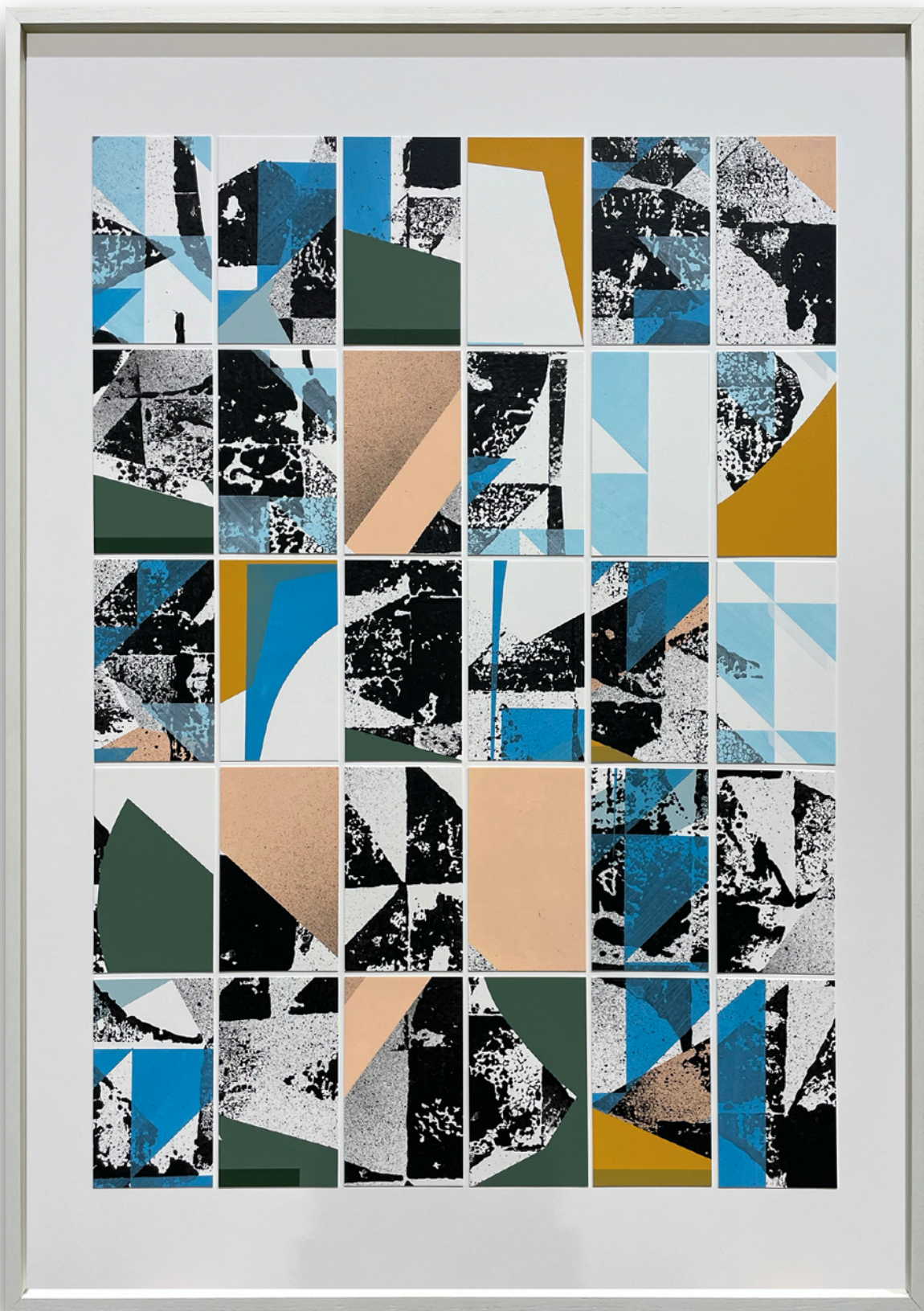
Christian KERA Hinz, o.T., P120, Papier & Acryl, 100x70cm, 2024