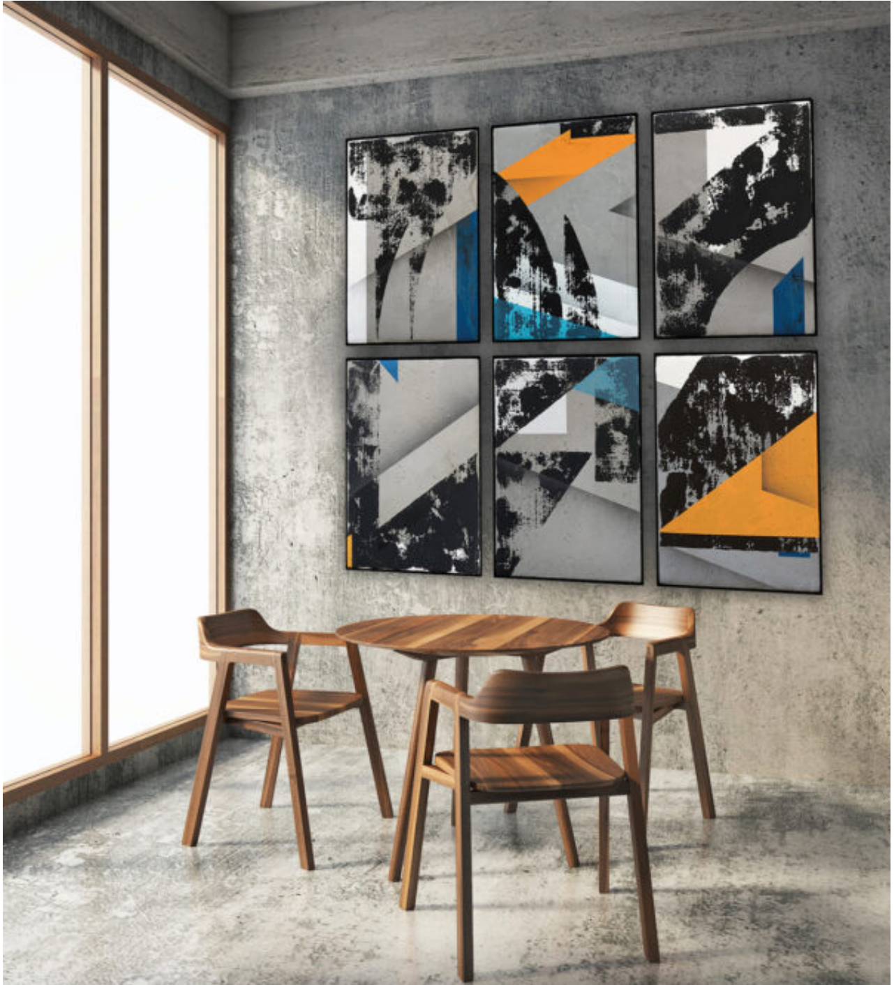
Christian KERA Hinz, o.T., 6 X Beton, Sprühlack & Acryl, 70x50cm, 2022