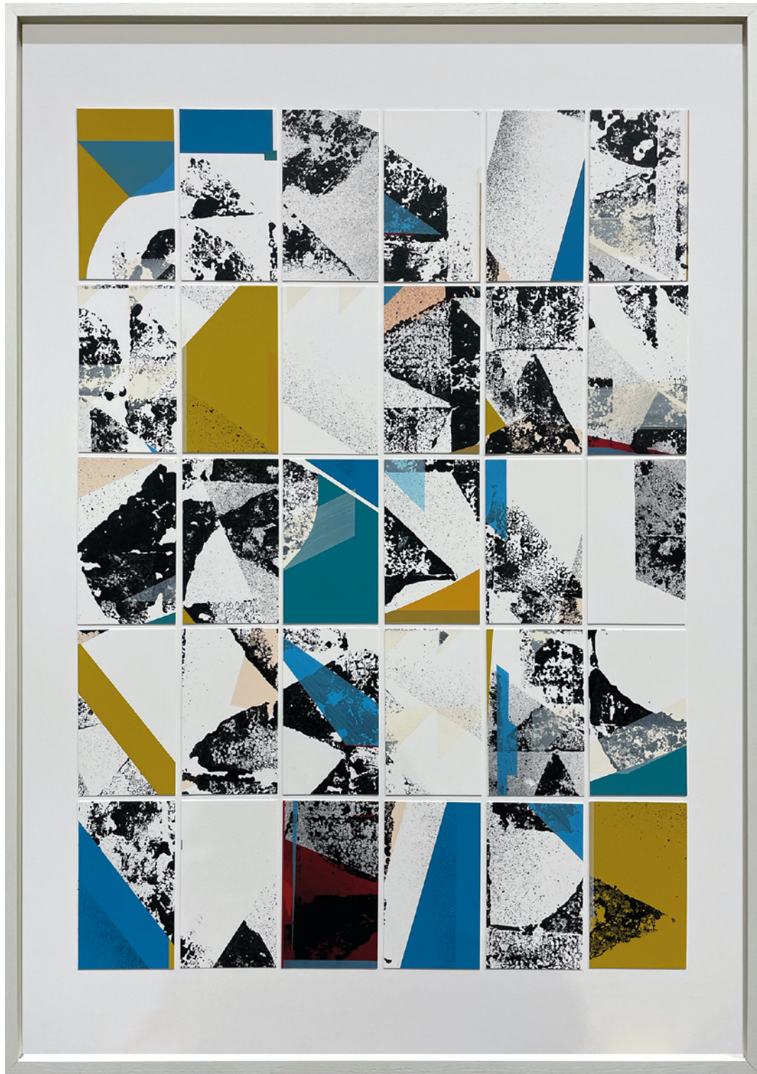
Christian KERA Hinz, o.T., Papier & Acryl, 100x70cm, 2024