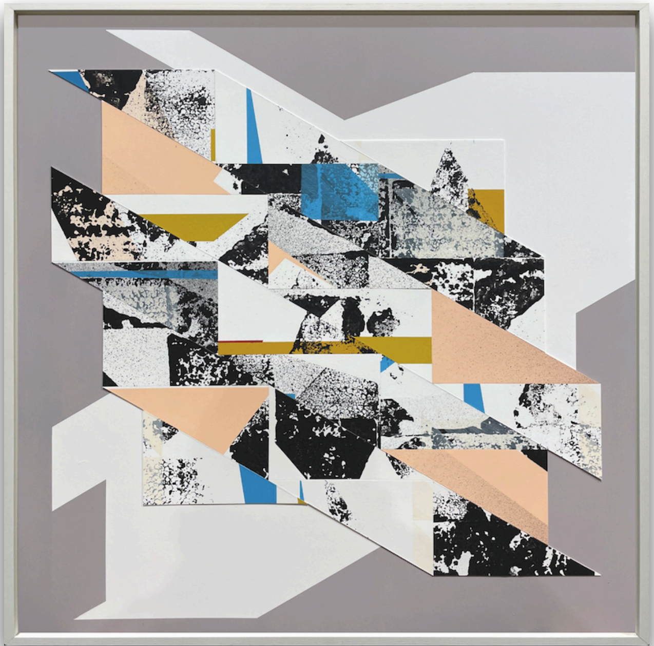
Christian KERA Hinz, o.T., P120, Papier & Acryl, 60x60cm, 2024